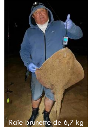
Raie brunette de 6,7 kg

L'open des 12 heures de Plouhinec - Erdeven, Trophée Jean-Jacques Thimonnier, a été reprogrammé les 5 et 6 septembre suite aux restrictions du COVID-19 et les gestes barrières ont été mis en place durant la compétition. Le tirage s'est effectué sur Facebook. Les secteurs et places ont été envoyés aux intéressés pour un rendez-vous sur les secteurs de pêche.